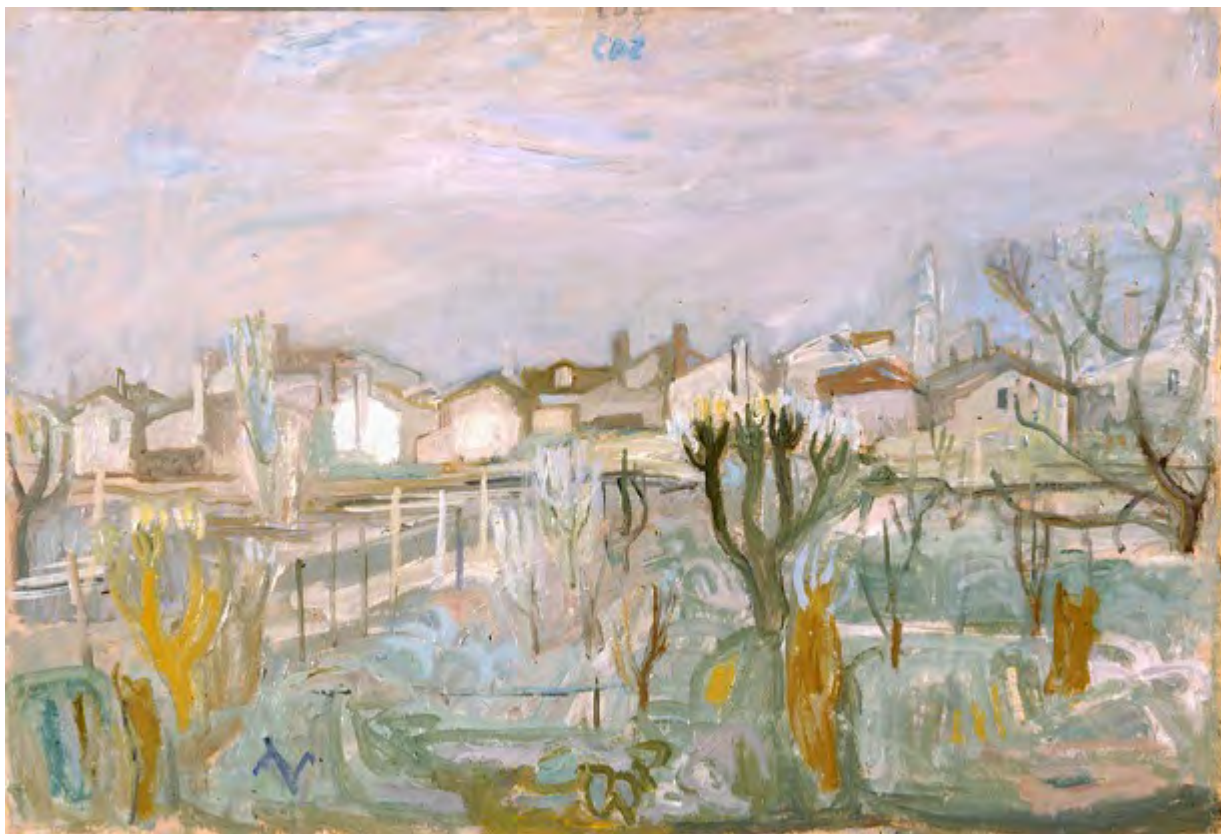
Carlo Dalla Zorza (Venezia 1896 – 1977), Paesaggio con orti e case a Burano , Olio su tela