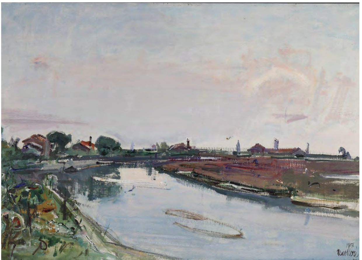
Neno Mori (Venezia 1898 – 1970), Paesaggio lagunare , Olio su tela