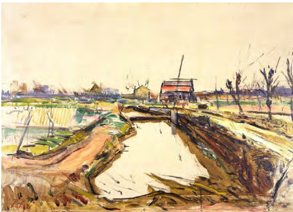
Fioravante Seibezzi (Venezia 1931 – 1975), Paesaggio lagunare , Olio su cartone